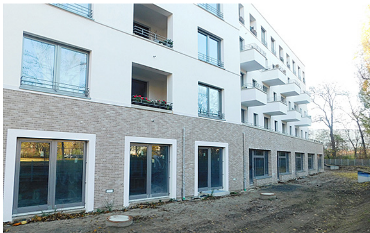
Diese Räume, geeignet für eine Kita, in einem Neubau der HOWOGE in der Rathausstraße stehen leider leer. Noch hat sich kein Träger gefunden.

Gründe dafür, dass der Bedarf zugenommen hat, liegen vor allem in den gestiegenen Geburtenzahlen, im Zuwachs und Zuzug und dass sich Kinder später einschulen lassen. Dass nicht genügend Plätze bereitgestellt werden können, hat zwei Hauptgründe: Es fehlt an Personal und es fehlt an Plätzen durch Kitabauten. Es braucht also mehr